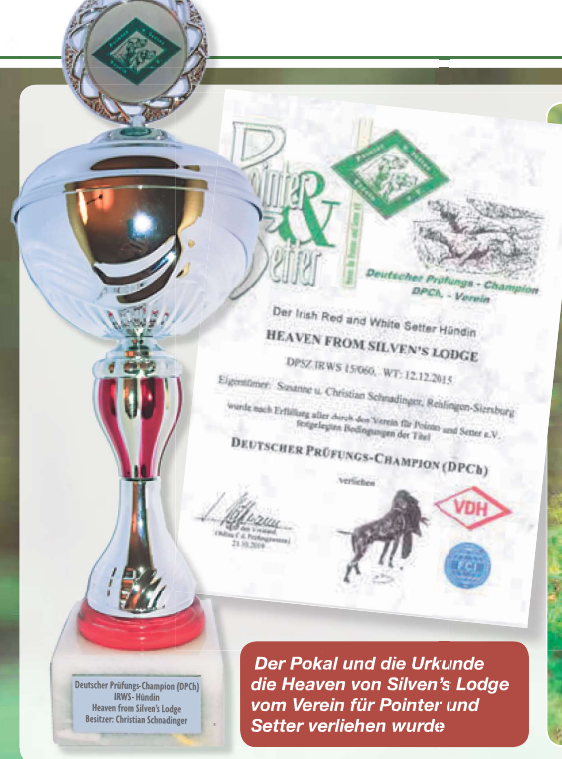
1 Der Pokal und die Urkunde die Heaven von Silven's Lodge vom Verein für Pointer und Setter verliehen wurde

verschiedenen Richtern. Und man glaubt es kaum, auch ein Formwert mit „sehr gut“ muss auf einer internationalen oder nationalen Ausstellung erworben sein. Beim IACH sogar auf einer internationalen Show. Prüfungen für Show-Titel werden in der Regel nicht zwingend verlangt. Beim IACH gilt alles in etwa analog nur international. Hier muss auch eine Anwartschaft im Ausland erworben sein. Die Prüfungsarten, bei denen die Anwartschaft CACIT ausgeschrieben werden können, sind bei der FCI hinterlegt. Arbeitsanwartschaften sowohl international als auch deutsche unterliegen strengen Maßstäben. Sie dürfen nur einem „leistungsmäßig überragenden Hund “ zuerkannt werden, der keinerlei Fehler gemacht hat und dessen Suche und Vorstehen von überragender Qualität waren. Wenn man sich die Prüfungsstatistik nach „Ostermann-schem“ System beim Verein für Pointer und Setter mal genau anschaut und sich mit den Leistungsprüfungen beschäftigt, wird man erkennen müssen, wie schwindend gering die Zahl der Hunde ist, die sich in der Nähe dieser Leistungsklasse befinden.